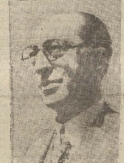
Dr. Tevfik Rüşti Aras

Eski Hariciye Vekili İstanbul hastanelerinden birinde çalışacak